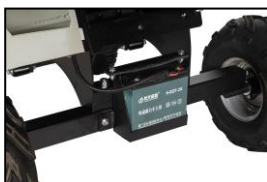
Batterie für Elektrostart