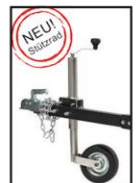
Abb. ohne Deichsel