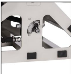
Geschwindigkeitsregler Einzugs walze